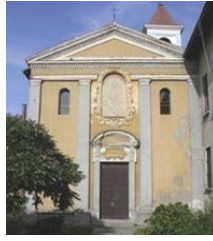
Santa Maria Assunta