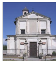
Natività di Maria Vergine 3334157336