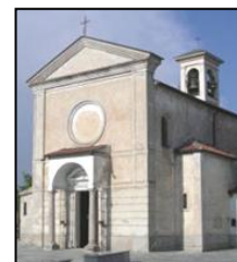
Santi Vincenzo e Bernardo 0290002319