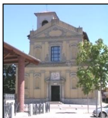
Santi Pietro e Paolo 3358220063