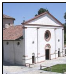
San Giacomo 335 8220063