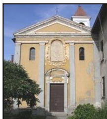
SANTA MARIA ASSUNTA 3358220063