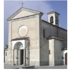
Santi Vincenzo e Bernardo 0290002319

sanpietrocusico@chiesadimilano.it zibido@chiesadimilano.it badile@chiesadimilano.it moirago@chiesadimilano.it www.vatican.va / www.chiesadimilano.it / www.parcchiedizibidosangiaco.it