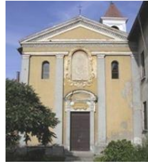
Santa Maria Assunta