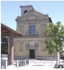
Santi Pietro e Paolo 3358220063