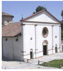
San Giacomo 0290002636-3358220063