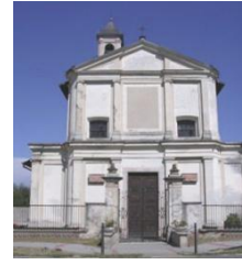
Natività di Maria Vergine 3334157336