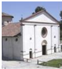
San Giacomo 0290002636-3358220063