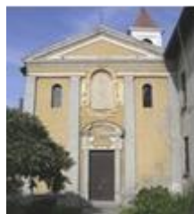
Santa Maria Assunta