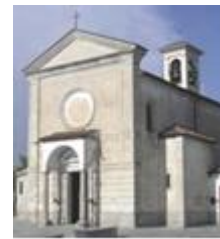
Santi Vincenzo e Bernardo 0290002319