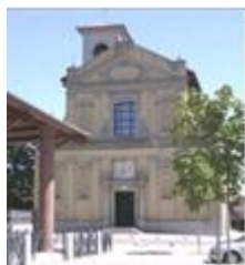
Santi Pietro e Paolo 3358220063